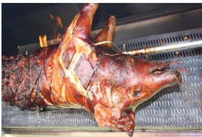
Spannferkel auf dem Grill, Foto: © TS / PIXELIO

Wie können wir hier Kühe essen? Im armen Indien habe ich gesehen, wie ein Ochse, dem ein Bein fehlte wegen einem Zusammenstoß mit dem Auto, weiter durchgefüttert wurde, er griff gierig mit seinen feuchten weichen Lippen nach meinen Keksen und Bananenchips.