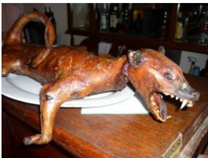
Gegrillter Hund, serviert auf einer Platte, Foto: eigene

Andere Länder, andere Sitten wie schon ein berühmtes deutsches Sprichwort sagt. Wer schon einmal im asiatischen Raum auf Reisen war, erzählt unglaubliche Sachen. Die da drüben essen Würmer und knusprige Heuschrecken, die aufgespießt wegzulaufen versuchen, bevor sie ins heiße Öl geworfen werden. Wie können die da drüben unsere Haustiere essen, Hunde oder Katzen?