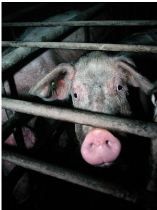
Schweine in der Massentierhaltung, Foto: Vier Pfoten - Stiftung für Tierschutz / pixelio.de

Weil die Tiere in der Enge der Massentierhaltung wahnsinnig werden und ihre Artgenossen angreifen, und weil das Fleisch von nicht kastrierten Schweinen nicht schmeckt. Die Fleischproduktion wurde in den letzten 50 Jahren wirtschaftlich so optimiert, dass die heute gezüchteten Tiere das Muskelfleisch in kürzester Zeit ansetzen, damit ihre Haltung am kürzesten ist, so bleibt das Fleisch für den Konsumenten billig. Die Knochen der Tiere können aber mit dem Muskelwachstum leider nicht mitwachsen und die Tiere leiden an Gelenkschmerzen, Gelenkverformungen oder schlicht Knochenbrüchen.