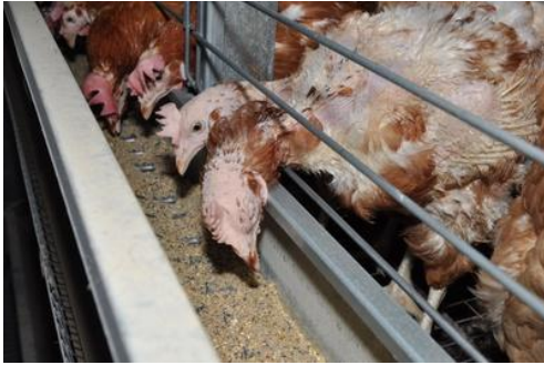
Legehennen in der Massentierhaltung, Foto: PeTA